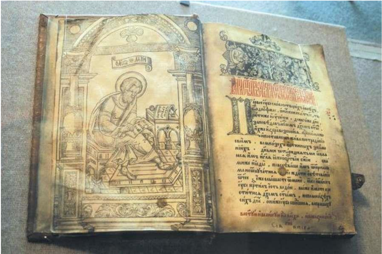
Иларион. «Слово о Законе и Благодати»