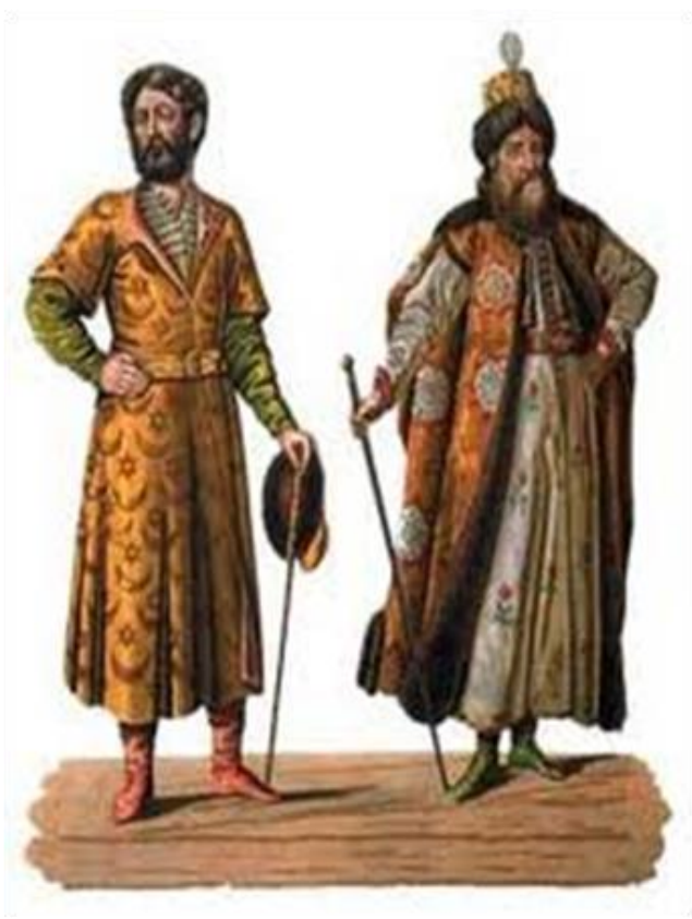
Старшая дружина _____